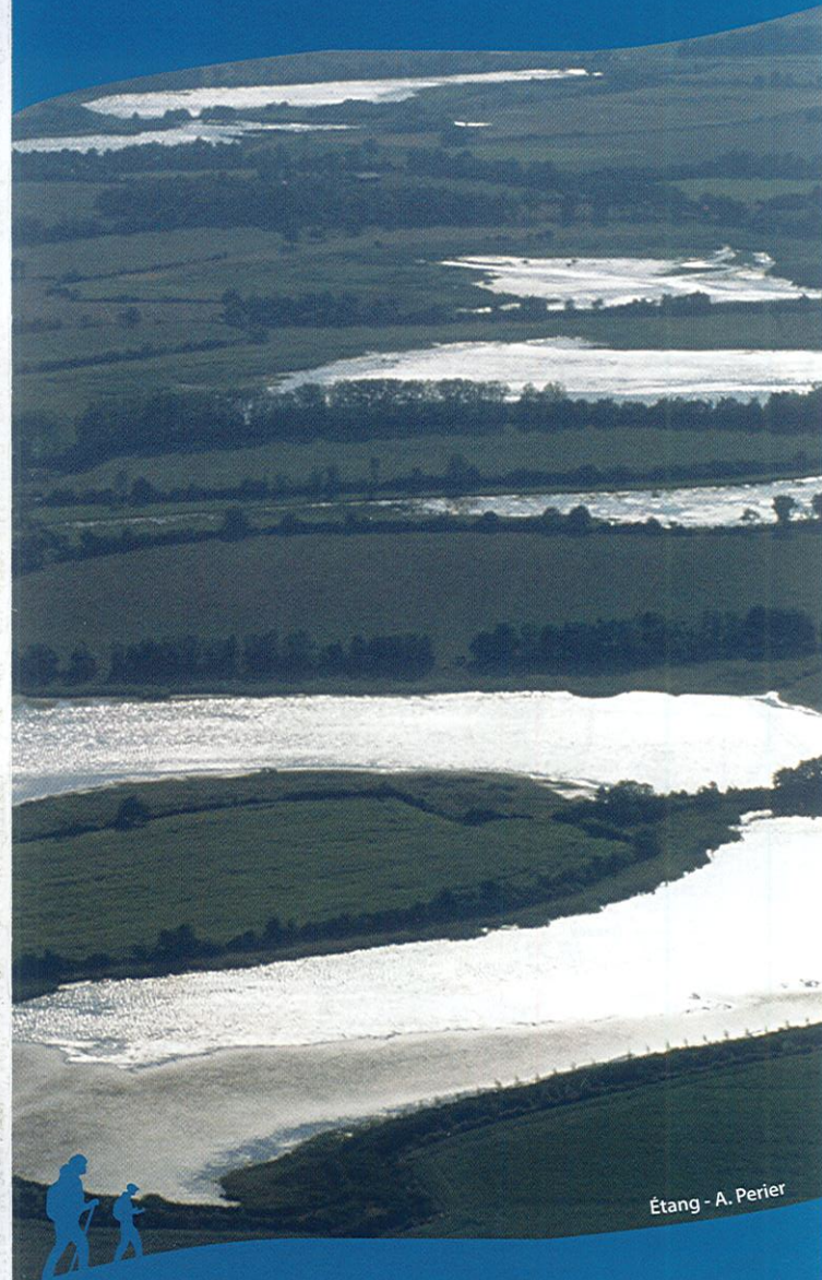
Étang - A. Perier

Circuits balisés par la CC Canton de Chalamont