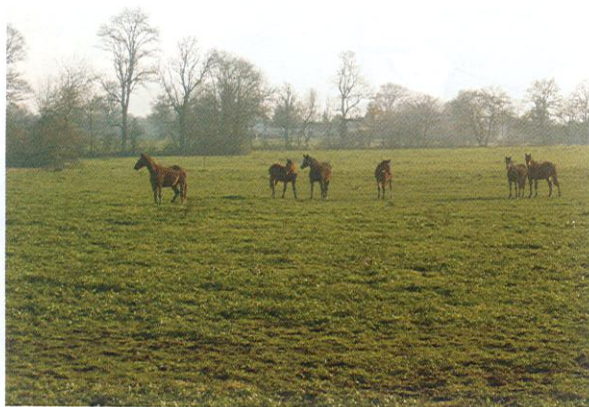
Chevaux - CDRP01